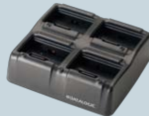
Einfach Lade-/Übertragungsstation und mehrfach Akkuladestation