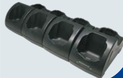
Mehrfach Lade-/Übertragungsstation (Ethernet)

Weitere Einzelheiten können Sie dem Benutzerhandbuch auf www.mobile.datalogic.com/manuals entnehmen. Mehr Informationen auch unter www.mobile.datalogic.com/datalogic/jet